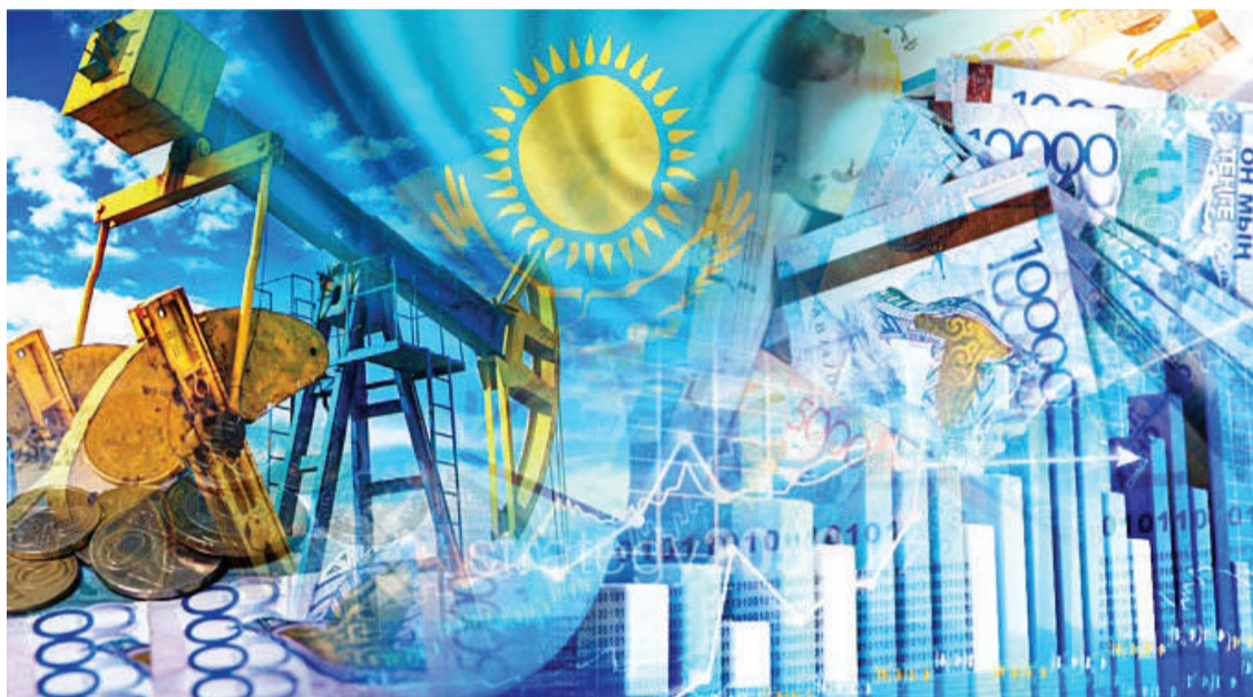
Елсәр ҚАБА (КОЛМӘЖ)

торы Дарина Кенестің пікірінше, Ел тәуелсіздік алған күннен бастап жеке сектор Қазақстанның дамуына елеулі үлес қосып келеді. Сондықтан кәсіпкерлікті дамыту мәселелері нарықтық экономиканы қалыптастыруда маңызды рөлге ие.