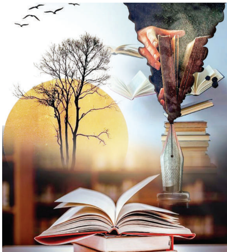
ЕАДПР ҚАБА (КОМ.СМ)